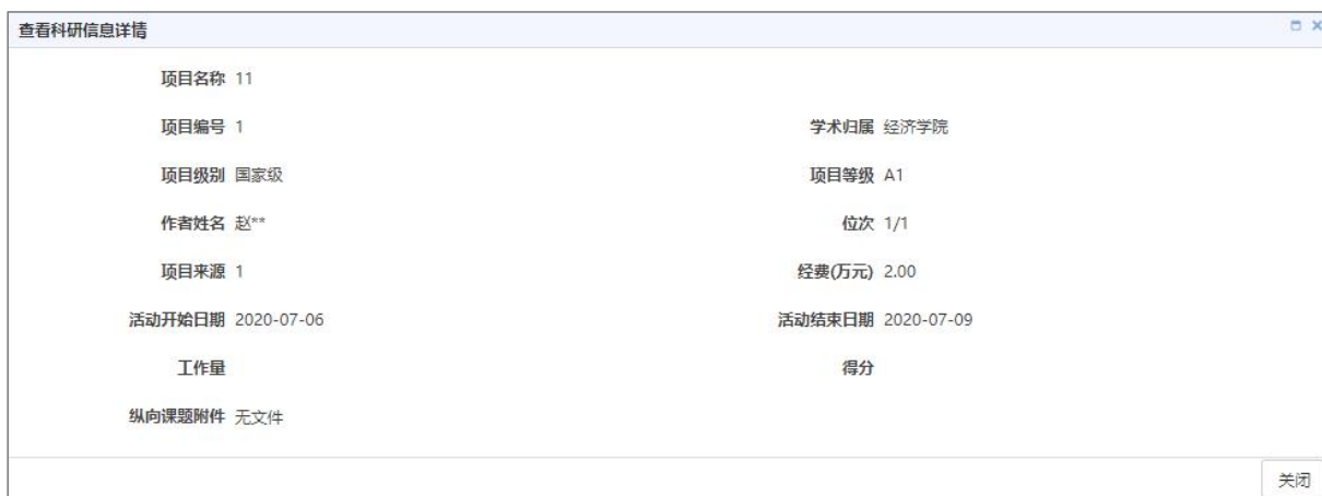
查看科研信息详情