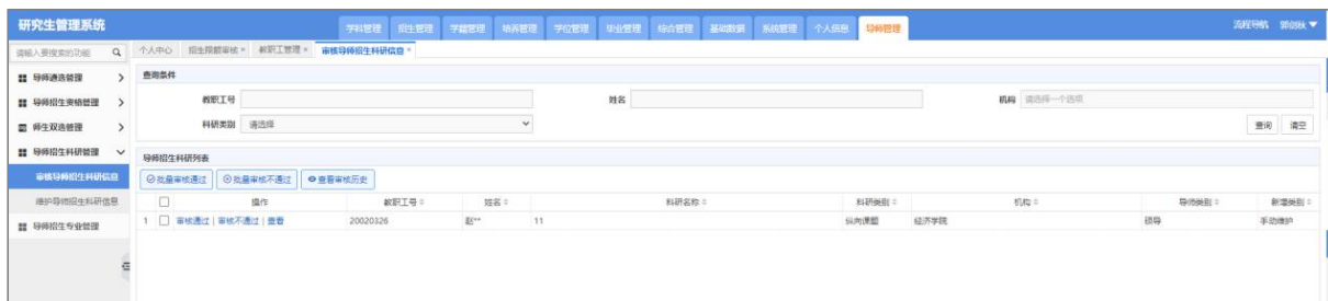
审核导师招生科研信息

支持【查看】、【审核通过】/【批量审核通过】、【审核不通过】/【批量审核不通过】。